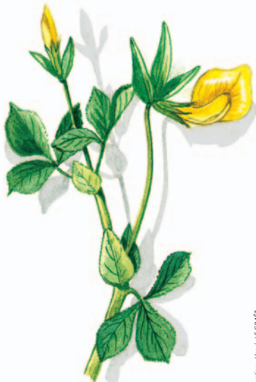
Illustration : Hervé LE COUÛT