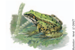
Illustration : Hervé LE GRÈT

Le chemin traverse le bois et le ruisseau des Vervelles. L'origine du nom "vervelles" n'est pas certaine, il en existe plusieurs versions. C'est avant tout un terme de fauconnerie qui signifiait l'anneau qui permettait d'attacher les armes et écussons du seigneur à qui appartenait le faucon. C'est également un terme nautique nommant les gonds placés dans la quille d'un bateau qui servent à accrocher le gouvernail. Enfin, ce terme nomme également les attaches d'un casque.